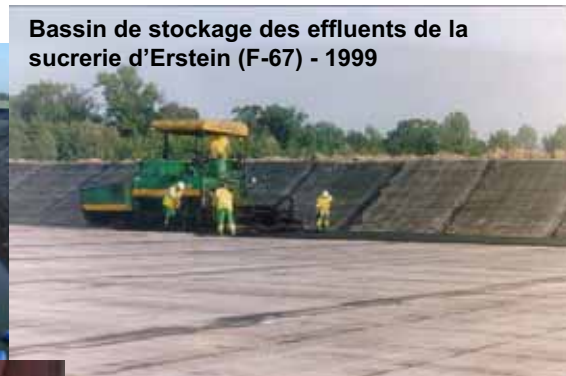
Bassin de stockage des effluents de la sucrerie d'Erstein (F-67) - 1999