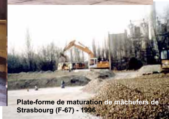
Plate-forme de maturation de mâchefers de Strasbourg (F-67) - 1996