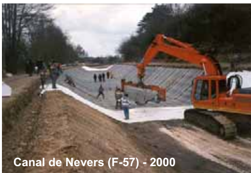
Canal de Nevers (F-57) - 2000

Assurer le transport de l'eau, pour desservir des champs d'irrigation ou alimenter des centrales hydroélectriques, la canaliser pour éviter ses mouvements parfois dévastateurs, ou tout simplement l'utiliser comme voie navigable : missions essentielles auxquelles répond COLETANCHE, seul ou en association avec un parement de béton, de gabions ou de rochers.