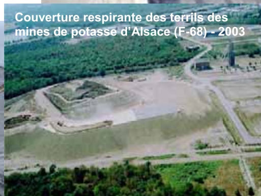
Couverture respirante des terrils des mines de potasse d'Alsace (F-68) - 2003