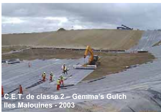
C.E.T. de classe 2 - Gemma's Gulch Iles Malouines - 2003