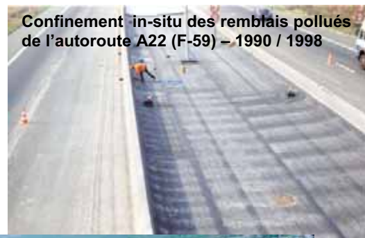
Confinement in-situ des remblais pollués de l'autoroute A22 (F-59) - 1990 / 1998

Empêcher la dissémination des pollutions par les eaux pluviales : COLETANCHE est couramment utilisé pour protéger des dépôts de déchets industriels (chromates, potasse), couvrir des terrils en fin d'activité ou des centres de stockages de déchets, et même assurer le confinement de déchets nucléaires à faible activité.