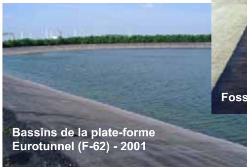
Bassins de la plate-forme Eurotunnel (F-62) - 2001