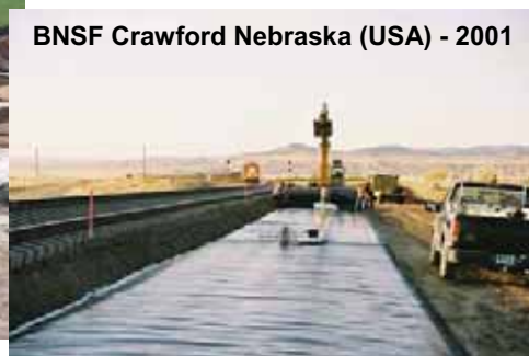
BNSF Crawford Nebraska (USA) - 2001