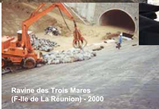
Ravine des Trois Mares (F-Ile de La Réunion) - 2000