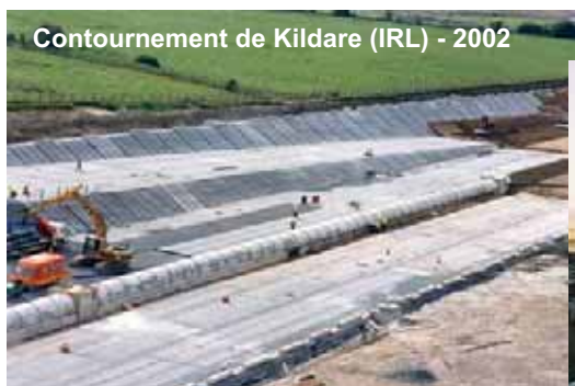
Contournement de Kildare (IRL) - 2002

Minimiser l'impact de la construction d'un ouvrage sur le milieu naturel, améliorer les conditions de réalisation d'un projet : COLETANCHE s'adapte aux chantiers difficiles : terrains inondables ou nappes phréatiques affleurantes, sols de faible portance, sous voies ferrées ou chaussées routières.