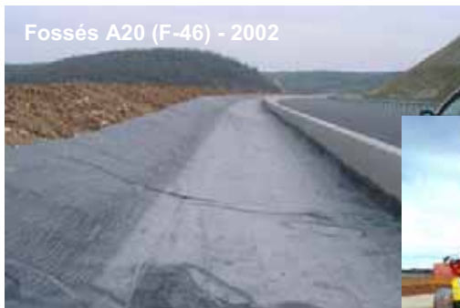
Fossés A20 (F-46) - 2002

Dans le cadre de l'application de la Loi sur l'Eau, COLETANCHE protège les nappes phréatiques et les cours d'eau par étanchéification des fossés long des routes et autoroutes, création de bassins de rétention, voire confinement total des champs captants.