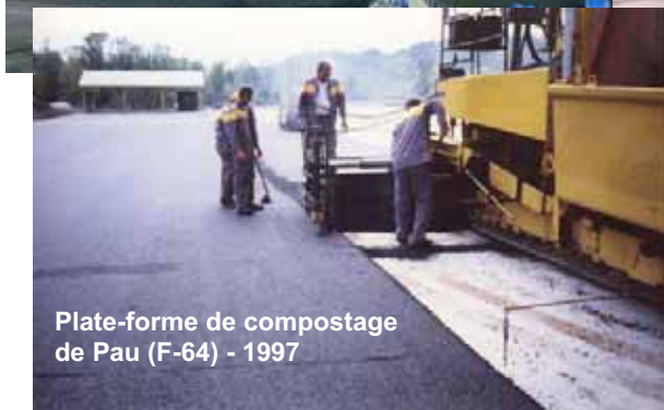
Plate-forme de compostage de Pau (F-64) - 1997