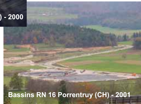
Bassins RN 16 Porrentruy (CH) - 2001