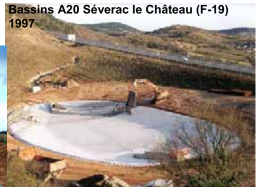
Bassins A20 Séverac le Château (F-19) 1997