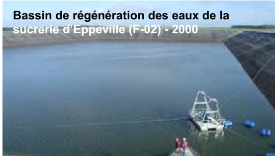
Bassin de régénération des eaux de la sucrerie d'Eppeville (F-02) - 2000

COLETANCHE trouve de multiples applications dans le domaine industriel, bassins de stockage d'effluents liquides ou de déchets solides divers, de lagunage, ou de lixiviation, plates-formes de maturation de mâchefers ou de compostage de déchets verts.