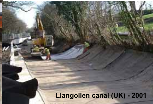
Llangollen canal (UK) - 2001