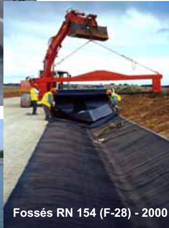
Fossés RN 154 (F-28) - 2000